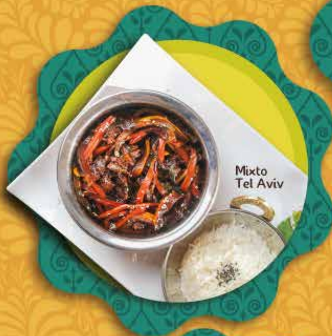
Mixto Tel Aviv