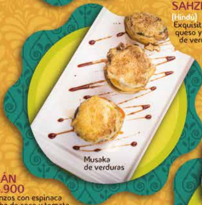
Musaka de verduras

GOLÁN $ 35.900 Garbanzos con espinaca en leche de coco y tomate