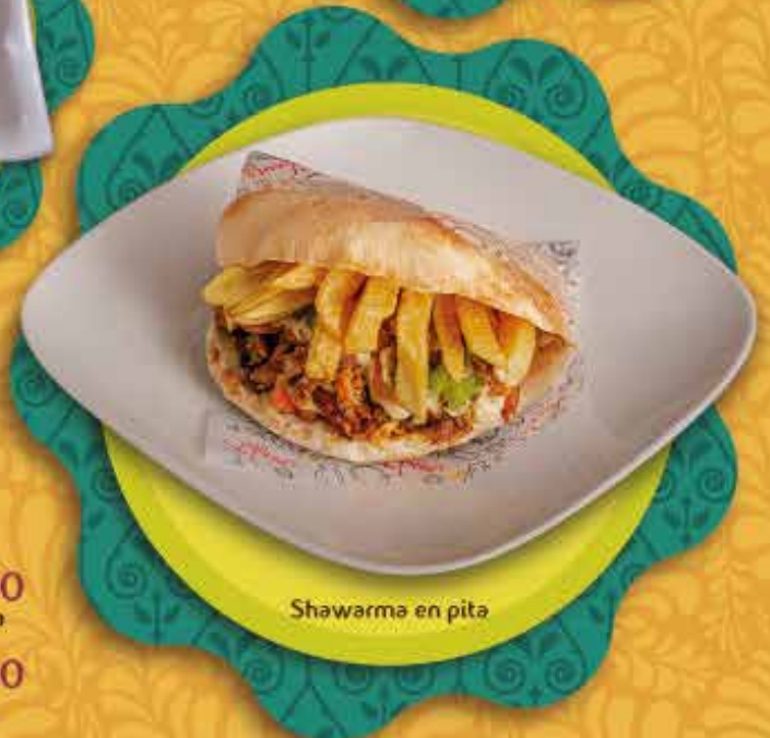
Shawarma en pita