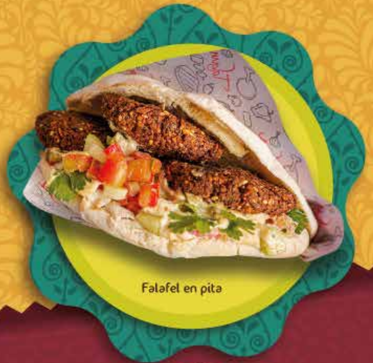
Falafel en pita

El sándwich tradicional viene con Hummus y tahina, ensalada árabe y papas a la francesa envuelto en el pan árabe. Puede ordenar el sándwich a su gusto, informe si desea realizar cambio de ensalada o papas