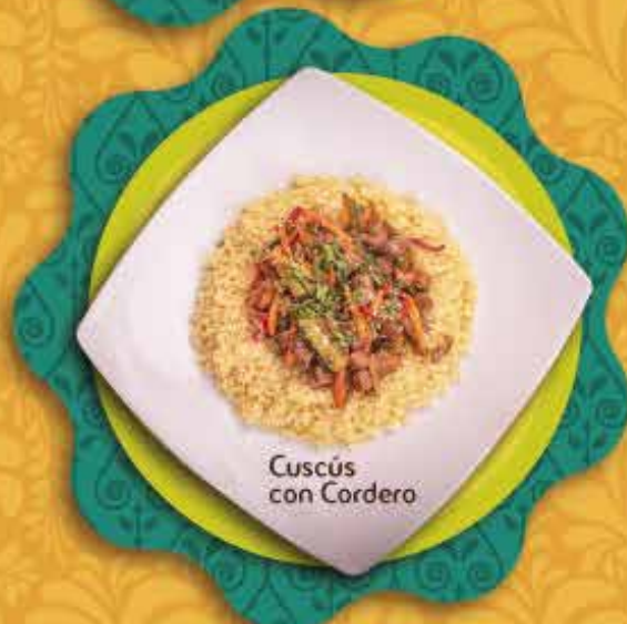
Cuscús con Cordero