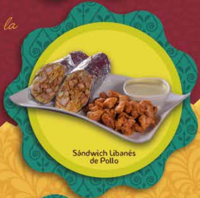
Sándwich Libanés de Pollo

El sándwich tradicional viene con Hummus y tahina, ensalada árabe y papas a la francesa envuelto en el pan árabe. Puede ordenar el sándwich a su gusto, informe si desea realizar cambio de ensalada o papas